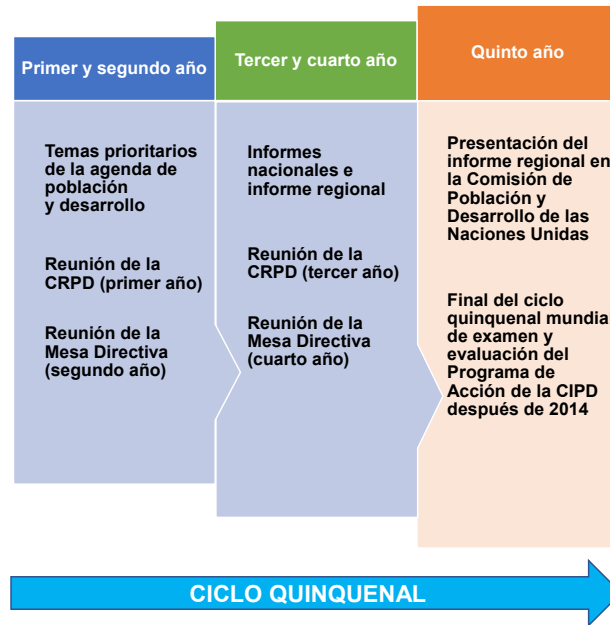
Diagrama 1 Organización temática de las reuniones para el seguimiento del Consenso de Montevideo y el examen y evaluación del Programa de Acción de la CIPD después de 2014

En el siguiente diagrama se presenta la distribución de actividades según el calendario propuesto, tanto para el ciclo quinquenal en curso (2019-2024) como para el siguiente (2024-2029).