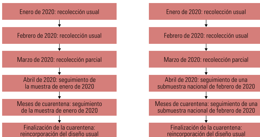
Diagrama 2 Escenarios de seguimiento de una muestra panel basada en recolecciones de información anteriores

En el diagrama 2 se exponen dos ejemplos de cómo un país puede hacer seguimiento a un panel proveniente de recolecciones anteriores. En el escenario de la izquierda se presenta un país que a partir de abril de 2020 tiene la capacidad para realizar un seguimiento telefónico (o por Internet) de los mismos hogares que se seleccionaron en enero de 2020. El segundo escenario ilustra un caso en que se realiza el seguimiento a una submuestra de hogares (o personas) basada en la muestra probabilística de febrero de 2020. En ambos casos, el seguimiento del panel está supeditado únicamente a la duración de las restricciones a la movilidad.