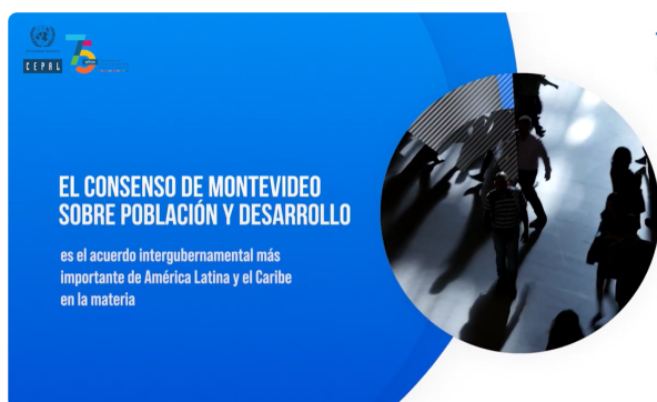
10 años del Consenso de Montevideo sobre Población y Desarrollo