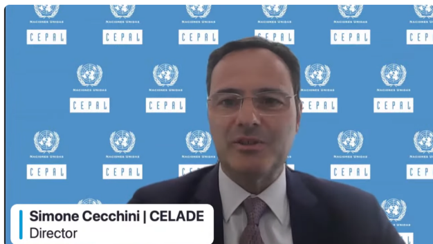
Lanzamiento del informe La Década del Envejecimiento Saludable en las Américas ESP