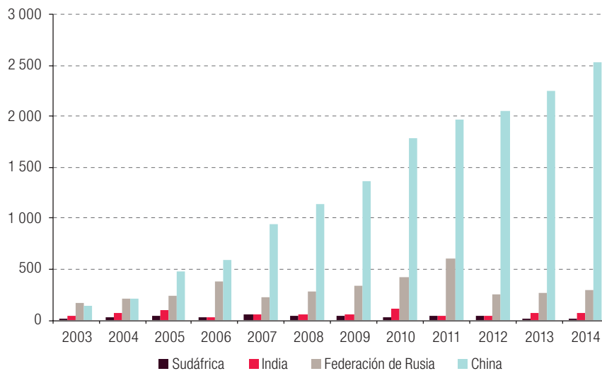
Gráfico 2 Evolución de las exportaciones del Nordeste del Brasil al bloque BRICS a , 2003 a 2014 (En millones de dólares FOB)