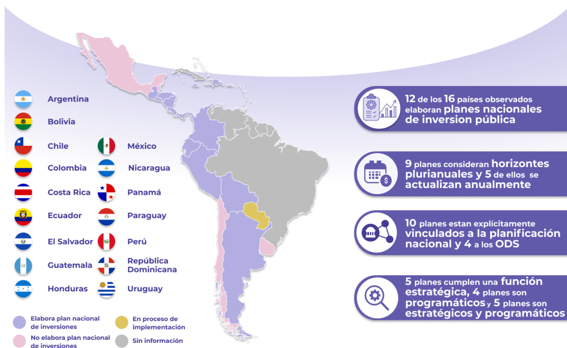
Figura 1. Planes nacionales de inversión pública en América Latina y el Caribe, Características seleccionadas Fuente: Elaboración propia en base del Observatorio Regional de Planificación y la Sistematización de los SNIP en América Latina y el Caribe 2019-2020 (ILPES/CEPAL).