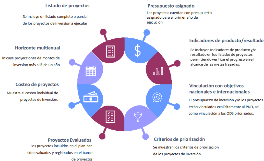
Figura 3. Características de los planes, estrategias o programas de inversión pública