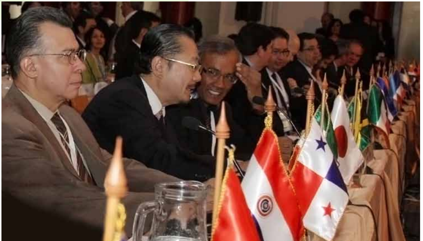
Le Bureau a réalisé un travail considérable pour présenter aux pays un ensemble coordonné de propositions relatives à l'axe population, territoire et développement durable.

4. Accueille favorablement la Charte de San José des droits des personnes âgées, adoptée lors de la troisième Conférence régionale intergouvernementale sur le vieillissement en Amérique latine et dans les Caraïbes, et remercie le Secrétariat de sa contribution technique ainsi que de la