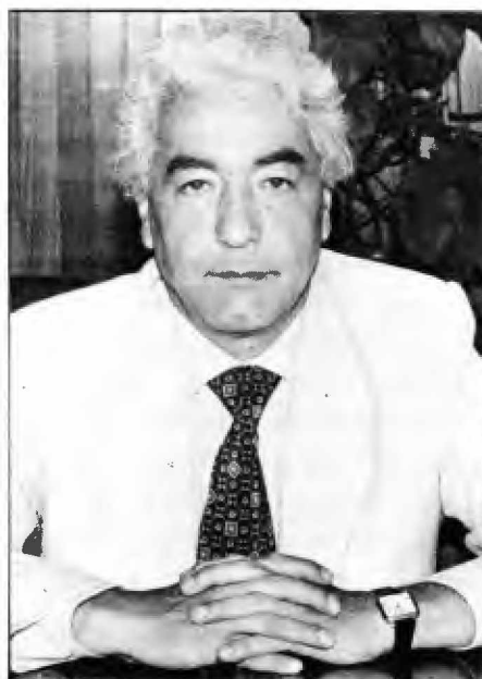
Arturo Núñez del Prado Director del ILPES

Durante sus treinta años de vida, el Instituto ha ido consolidando una significativa presencia que lo ha convertido en un verdadero patrimonio de la región. Su permanente vocación de servicio se ha traducido en una amplia gama de actividades desplegadas a lo largo de su historia. Cabe destacar su apoyo a los gobiernos en la construcción y el perfeccionamiento de estructuras