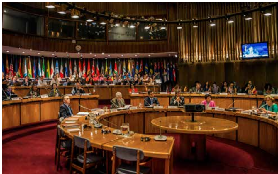
En esta primera reunión de la Mesa Directiva participaron representantes de países miembros de la CEPAL, de otras agencias del sistema de las Naciones Unidas, organismos intergubernamentales, académicos y miembros de la sociedad civil.

La fecundidad adolescente es uno de los temas que presenta particularidades marcadas en la región, y que está contemplado en el Consenso tanto a partir de la consideración de los derechos de los adolescentes como de la salud sexual y reproductiva. El estudio presentado por el CELADE en la reunión muestra que la reducción de la maternidad adolescente ha sido mucho menor que la de la fecundidad total, y que está crecientemente asociada a un incumplimiento de derechos, pues se constata un fuerte aumento del porcentaje de nacimientos no deseados entre las adolescentes. También revela que la desigualdad del calendario reproductivo