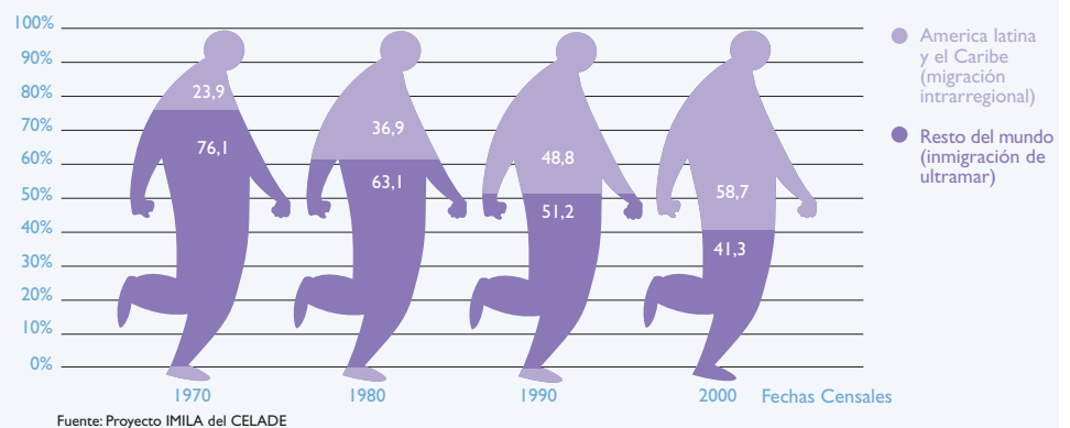
Porcentaje de población inmigrante en América Latina y el Caribe, según procedencia

En los últimos 30 años, la inmigración en el conjunto de los países de América Latina y el Caribe pasó a ser predominantemente de origen regional.