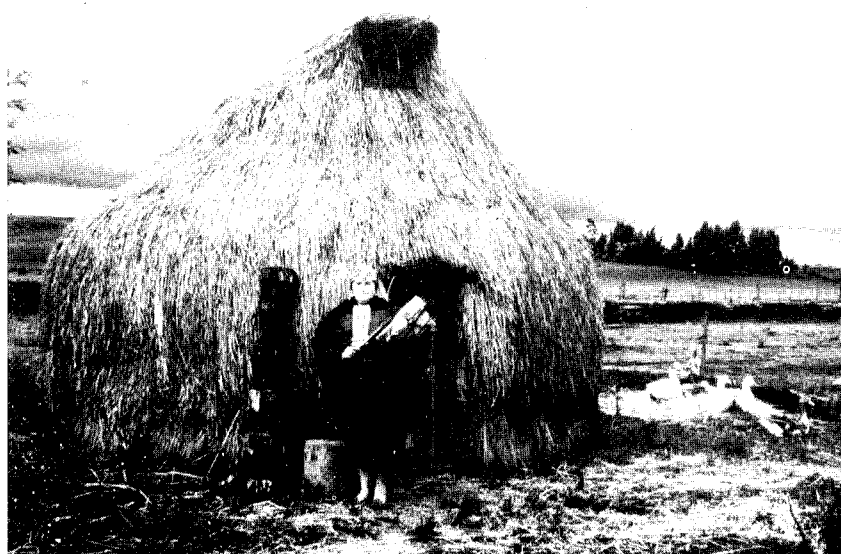
La ruca constituye sólo el 7% de las viviendas mapuches.

La ruca, vivienda tradicional mapuche, ocupó superficies que variaban entre 120 a 140 metros cuadrados y en el interior de esta estructura, construida con distintos tipos de fibra vegetal, vivieron grupos de hasta 100 personas. Este tipo de construcción era funcional a la familia extensa, que predominaba en la zona en el pasado.