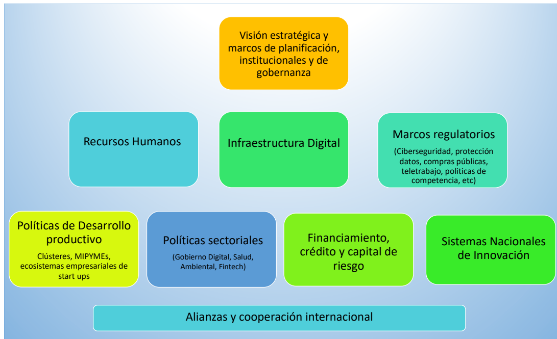
Gráfico 2 Transformación digital: nueve factores básicos o impulsores ("drivers")

Con base en la abundante literatura sobre el tema 47 , Salazar-Xirinachs (2021) propone una lista corta de nueve factores básicos o impulsores de la transformación digital, que sirve de marco conceptual para pensar los retos y oportunidades, y que se resumen en el Gráfico 2.