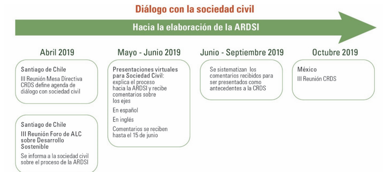
Diagrama 1 Mapa de tiempo en el que se inserta el diálogo con la sociedad civil