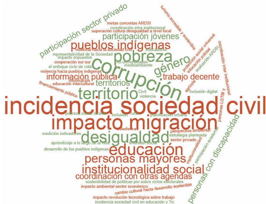
Gráfico 2 Nube de palabras de los comentarios recibidos