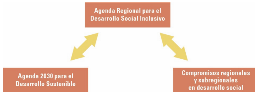
Diagrama 1 Relación entre ARDSI, Agenda 2030 para el Desarrollo Sostenible y Acuerdos en desarrollo social

Con el objetivo de apoyar la implementación de la Agenda 2030 para el Desarrollo Sostenible, particularmente en las áreas relacionadas con los mandatos de los Ministerios de Desarrollo Social y entidades equivalentes, la Agenda Regional de Desarrollo Social Inclusivo (ARDSI) se conforma como una herramienta fundada, por un lado, sobre las metas de los Objetivos de Desarrollo Sostenible (ODS) de la Agenda 2030 para el Desarrollo Sostenible relacionadas directa e indirectamente con la dimensión social y, por otro lado, con base en las principales poblaciones, temáticas y medios de implementación abordados por los compromisos regionales y subregionales en desarrollo social alcanzados en foros intergubernamentales en los que han estado presente los Ministerios y Secretarías de Desarrollo Social, o entidades equivalentes (véase el diagrama 1). Adicionalmente, la ARDSI comprende determinadas temáticas que son relevantes para el desarrollo inclusivo de la región, pero que no han sido recogidas por los instrumentos mencionados. En el presente documento se muestra información respecto a estas relaciones.