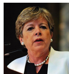
Alicia Bárcena Secretaria Ejecutiva CEPAL

E l mundo requiere de un nuevo estilo de desarrollo que coloque a la igualdad y a la sostenibilidad en el centro. Esa es la médula de la propuesta que desde la CEPAL hacemos a nuestra región y es la manera cómo interpretamos e impulsamos el cumplimiento de la agenda 2030.