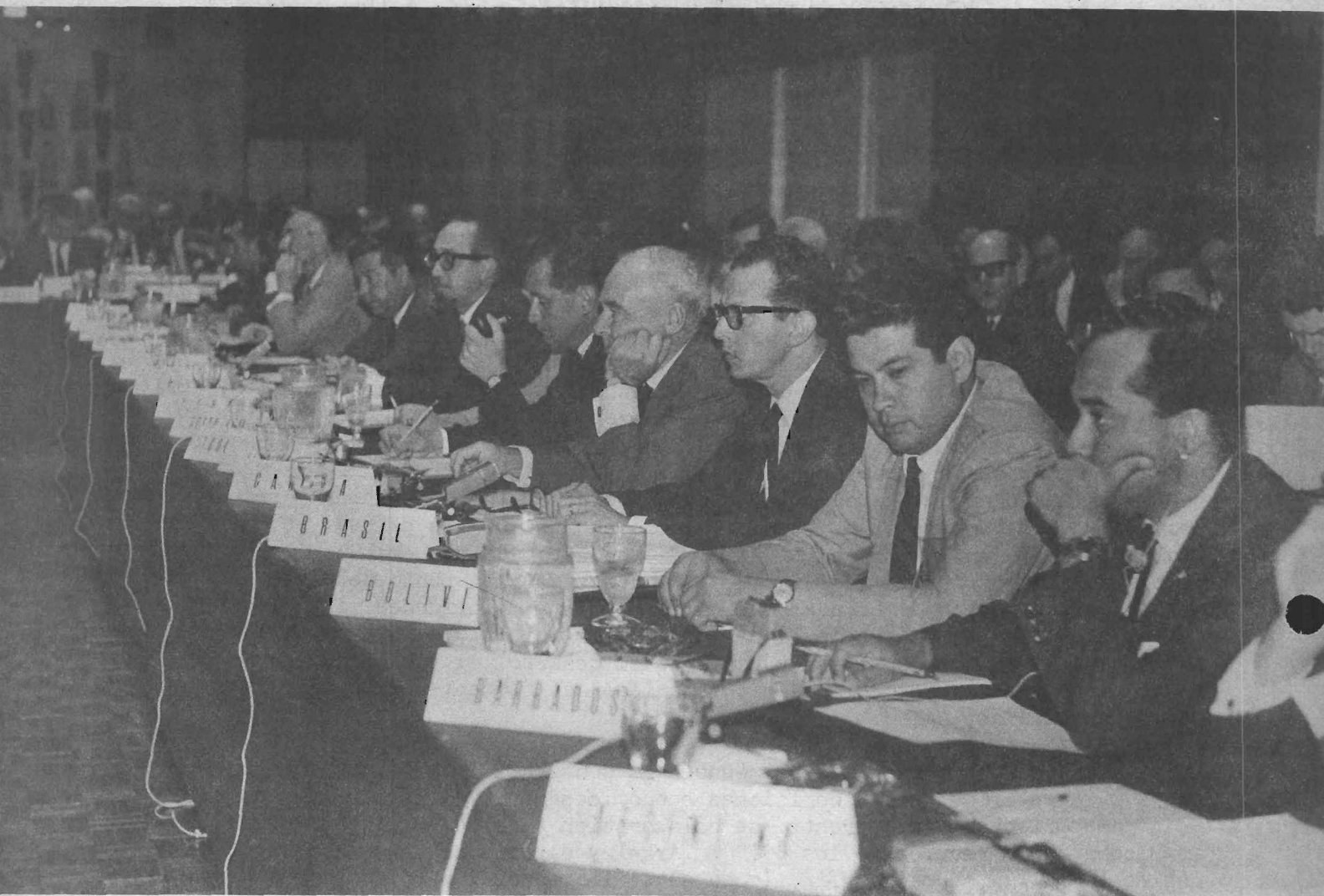
... Los países miembros de la CEPAL acuerdan medidas sobre política comercial ...

daciones pertinentes de la UNCTAD", y que "de adoptarse medidas de financiamiento suplementario, los recursos destinados a tal fin representen una adición efectiva a la asistencia destinada al financiamiento básico para el desarrollo".