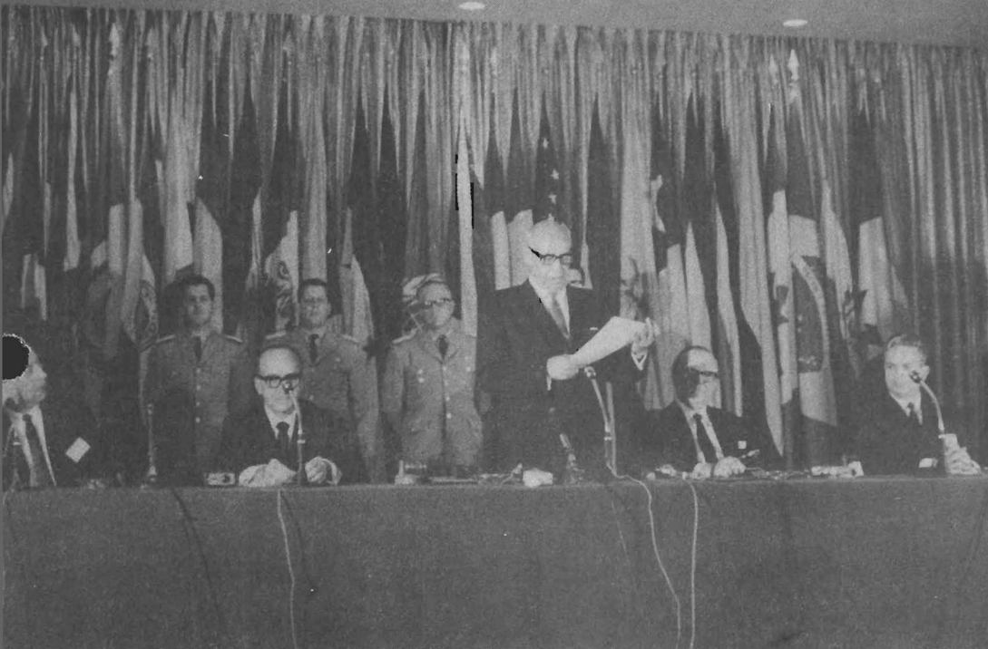
El XII Período de Sesiones de la CEPAL