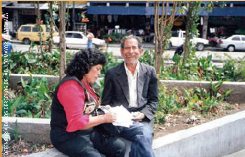
DEFENSORÍA DE LOS DERECHOS DEL ADULTO MAYOR, GUATEMALA