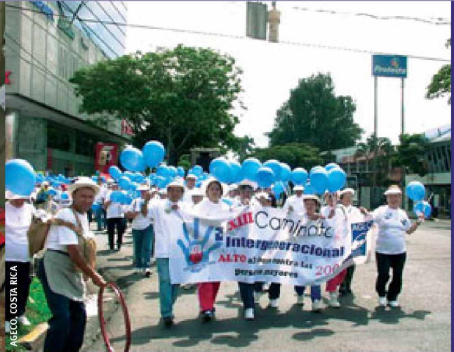
AGECO, COSTA RICA

República Dominicana y Bolivia se refieren expresamente a las personas mayores en sus leyes contra la violencia intrafamiliar. Varios pasos más adelante va Brasil, cuyo “Estatuto do Idoso” –una ley especial sobre las personas mayores- establece multas y penas de detención e incluso reclusión en casos de maltrato, dependiendo de sus consecuencias.