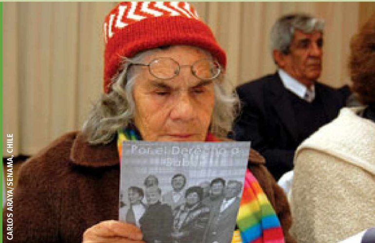
CARLOS ARAYA/SENAMA, CHILE