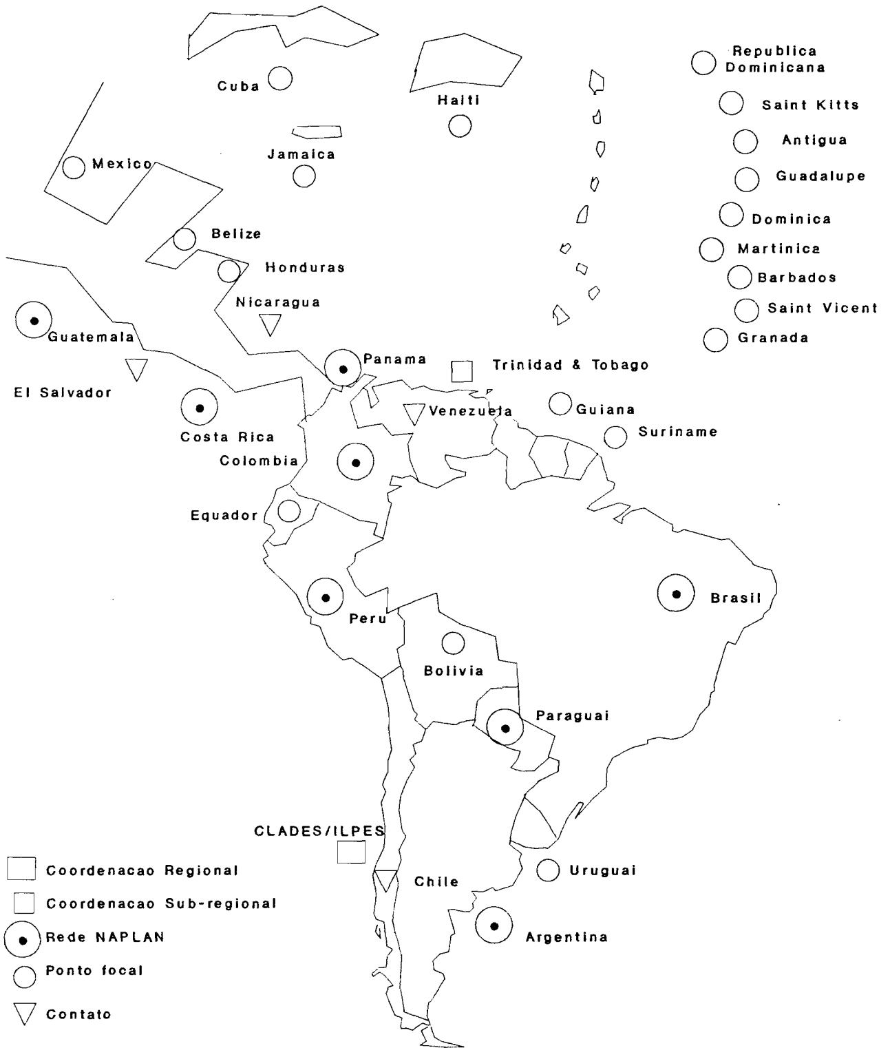
FIGURA 1 Cobertura Geográfica do Sistema INFOPLAN