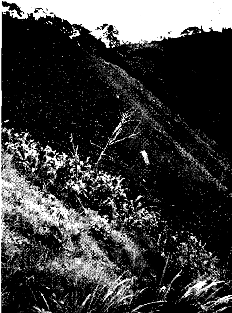
Desbosque y cultivo en ladera, Lago Coatepeque, San Salvador

del campo en muchos casos se lleva a cabo a consecuencia de una privación absoluta de necesidades básicas de vida. Ocurre a menudo que se toma la decisión a migrar sin saber exactamente cuáles son las condiciones reales de vida en las áreas urbanas, incluso se toma la decisión sabiendo que es muy difícil conseguir trabajo y alojamiento en la ciudad, pero toman el riesgo en la esperanza que algún día lograrán una vida mejor a la que tenían.