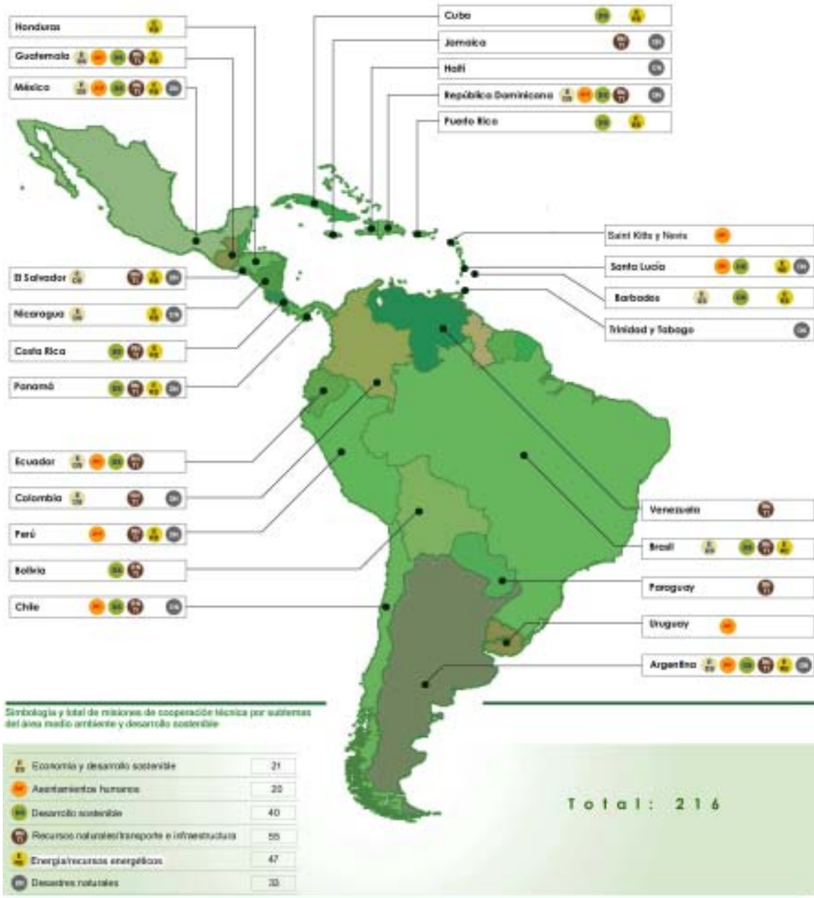
Gráfico 4 MISIONES DE COOPERACIÓN TÉCNICA DE LA CEPAL, BIENIO 2002-2003 ÁREA MEDIO AMBIENTE Y DESARROLLO SOSTENIBLE

Nota: Los límites y los nombres que figuran en este mapa no implican su apoyo o aceptación oficial por las Naciones Unidas.