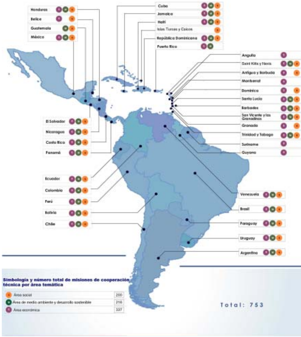
Gráfico 1 MISIONES DE COOPERACIÓN TÉCNICA DE LA CEPAL, BIENIO 2002-2003

Nota: Los límites y los nombres que figuran en este mapa no implican su apoyo o aceptación oficial por las Naciones Unidas.