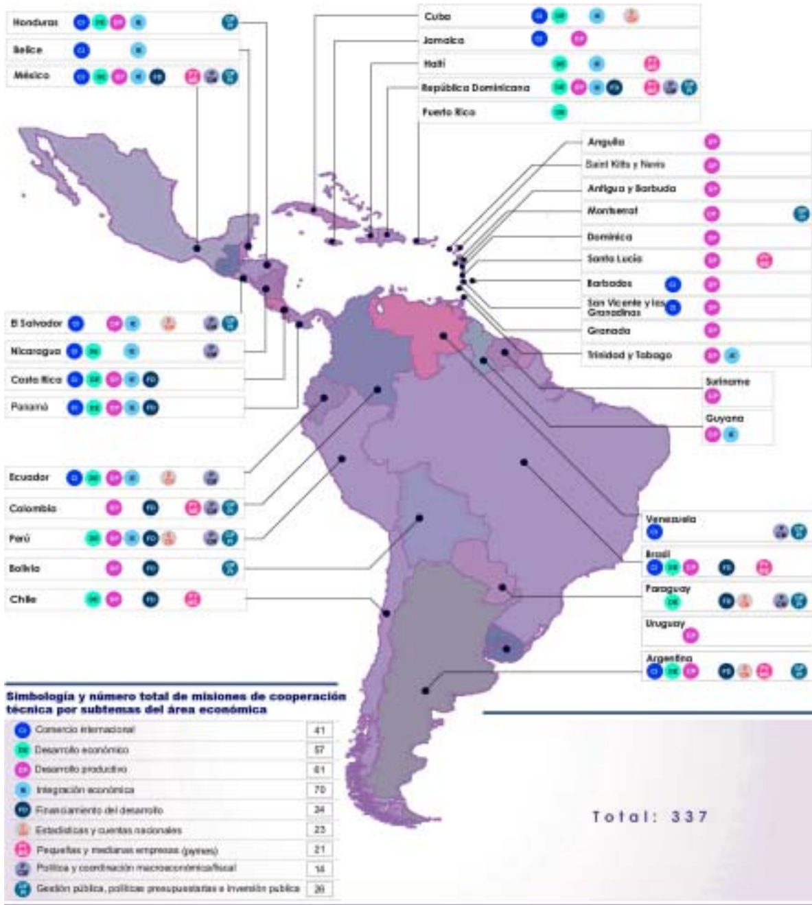
Gráfico 2 MISIONES DE COOPERACIÓN TÉCNICA DE LA CEPAL, BIENIO 2002-2003 ÁREA ECONÓMICA

Nota: Los límites y los nombres que figuran en este mapa no implican su apoyo o aceptación oficial por las Naciones Unidas.