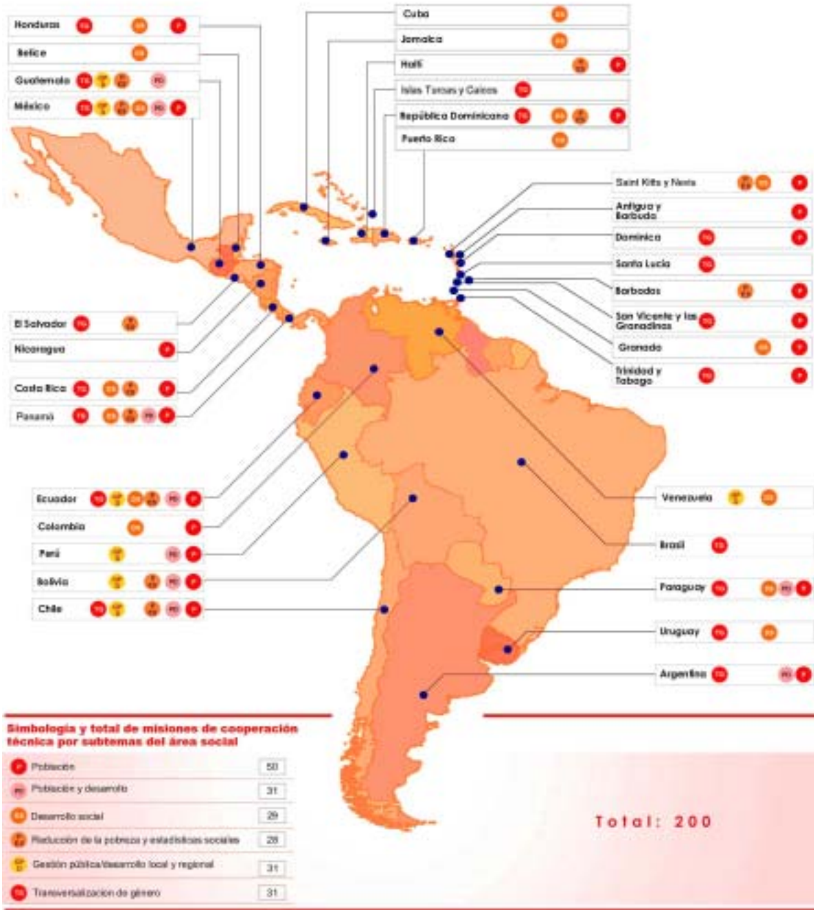
Gráfico 3 MISIONES DE COOPERACIÓN TÉCNICA DE LA CEPAL, BIENIO 2002-2003 ÁREA SOCIAL

Nota: Los límites y los nombres que figuran en este mapa no implican su apoyo o aceptación oficial por las Naciones Unidas.