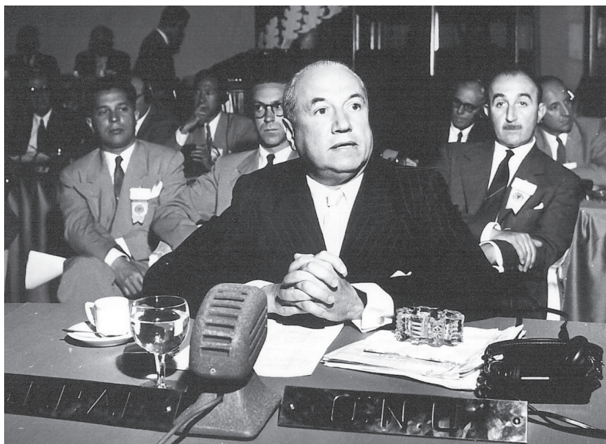
Prebisch en la UNCTAD II, Nueva Dehli, India, 1968, discurso final.

La influencia de Prebisch y la CEPAL se extendió también al resto de los países en desarrollo de Asia y África, inicialmente al nivel intelectual y académico por su concepción teórica del enfoque centro-periferia y su corolario, la necesidad de la acción deliberada del Estado para superar esa condición de dependencia e inducir y apoyar su incorporación a la sociedad industrial, y posteriormente, mediante su papel fundamental en la creación