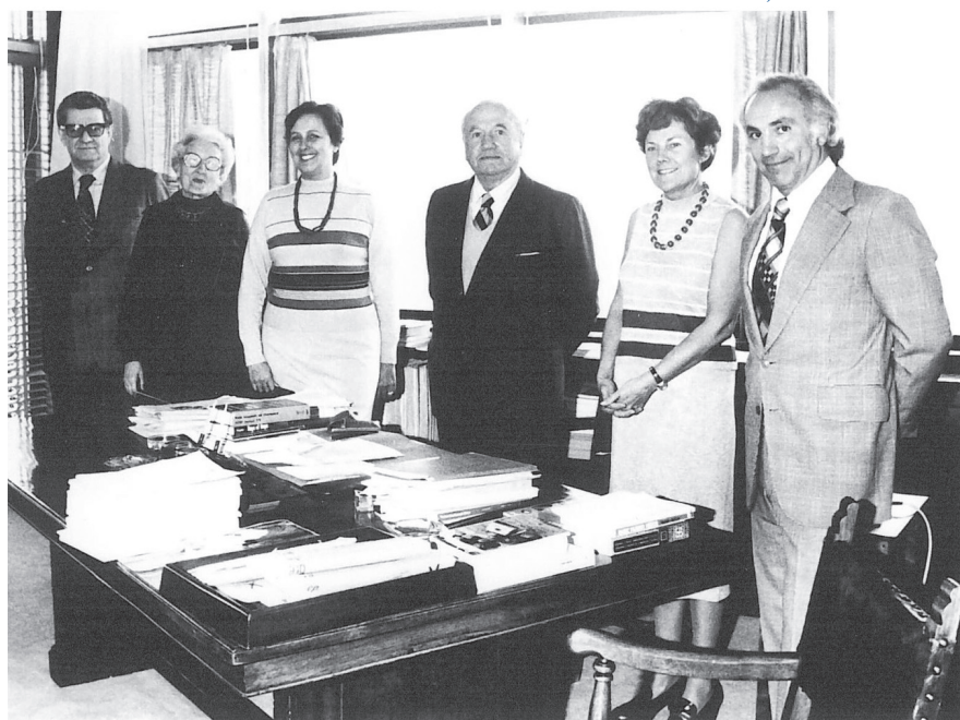
Último equipo de Raúl Prebisch: la Revista CEPAL, 1976.

Su conocimiento del comercio exterior y de los consiguientes flujos financieros lo llevó después a trabajar con algunos de los sectores más tradicionales y oligárquicos de la sociedad argentina, como la sociedad rural, profundamente interesados en las negociaciones de su país con el Reino Unido. Ahí tuvo la afortunada oportunidad de ser enviado a Australia, Nueva Zelandia y el Canadá, países que compartían