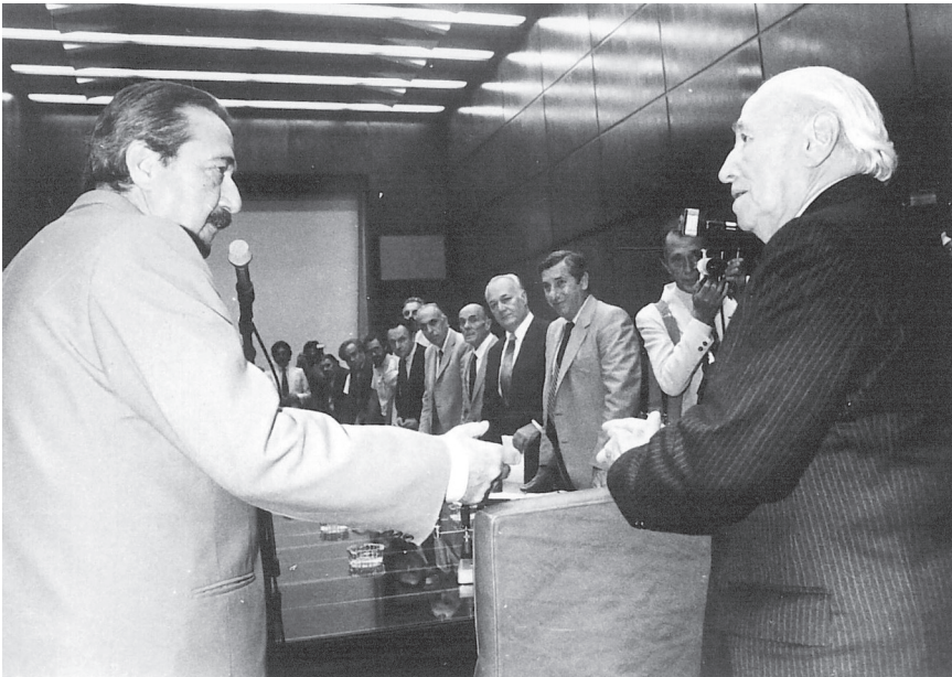
Prebisch y el Presidente Raúl Alfonsín, Buenos Aires, 1984.

Quisiera terminar estas líneas de aprecio y agradecimiento por la obra de Edgar Dosman y su notable y exitoso esfuerzo por revivir a través de ella la vida, figura, pensamiento y época de Raúl Prebisch, refiriéndome a su última etapa, cuando Enrique Iglesias lo invita a regresar a Santiago para dar vida en 1976 a una antigua aspiración suya, la Revista de la CEPAL . En esta etapa va elaborando en varias entregas su crítica del “capitalismo periférico”, que anticipa los efectos negativos de la globalización: la apertura y endeudamiento externo indiscriminados