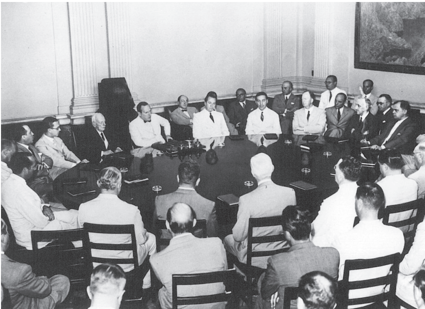
Prebisch y la junta directiva del Banco Central de Argentina, 1953.