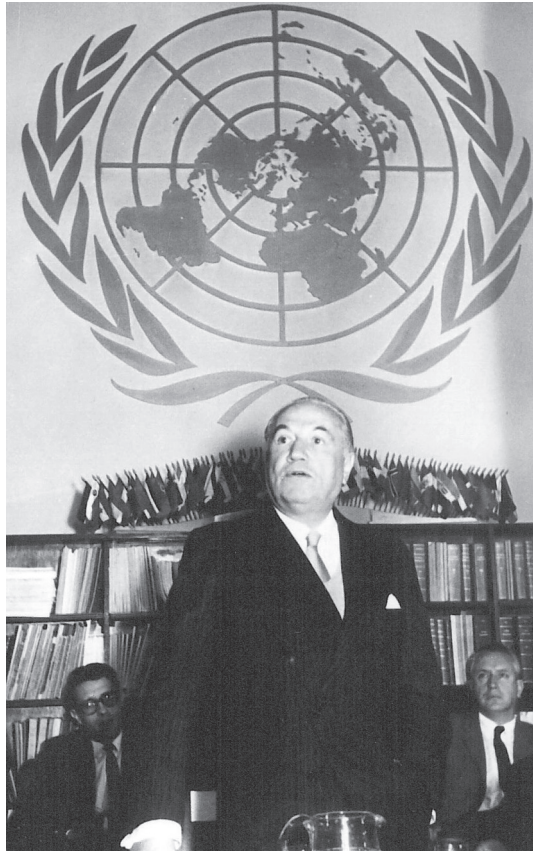
Prebisch en la sede de la UNCTAD, Ginebra, 1965.

Como usted sabe, en este período actual el pensamiento de la CEPAL se inspira en un enfoque que llamamos “neoestructuralista”. El prefijo expresa las adecuaciones que se han hecho a partir de fines de los años ochenta al esquema estructuralista, para conectar el pensamiento