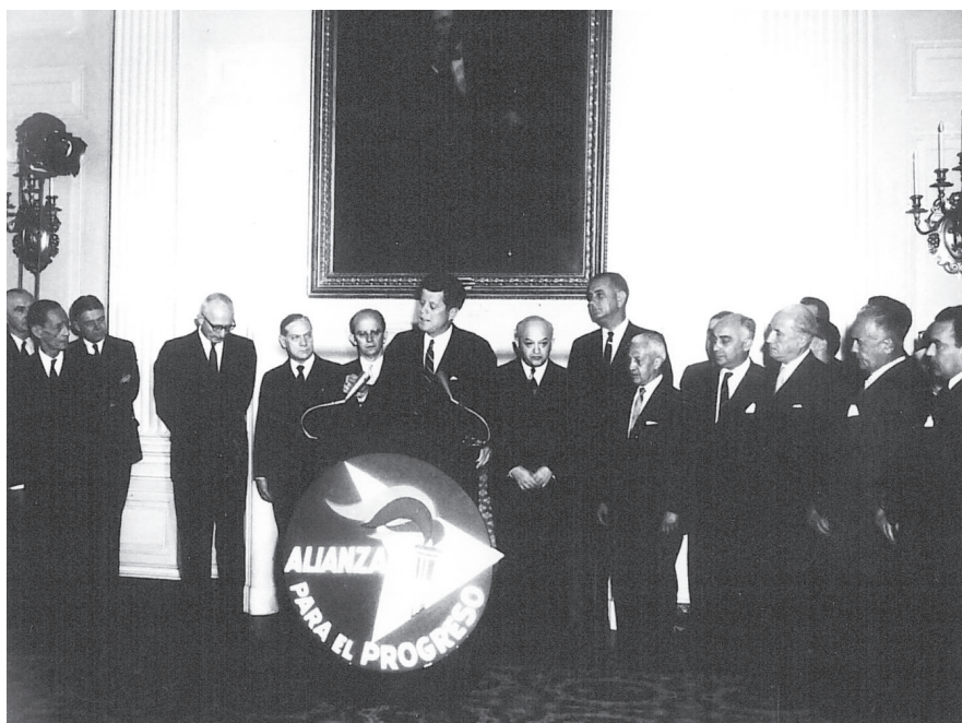
John F. Kennedy lanza la Alianza para el Progreso, 1961. Prebisch es el tercero de la derecha.