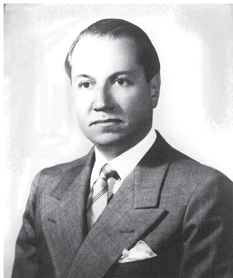
Prebisch cuando era subsecretario de Finanzas de la República Argentina, 1930.