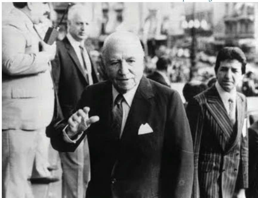
Raúl Prebisch ingresando al Congreso de la República Argentina.

En efecto, cuando al cabo de este reconocimiento de América Latina llega a la CEPAL, en 1948, como lo grafica el título de uno de los capítulos del libro, literalmente “inventa” América Latina, con un documento que, según Hirschman, es el “manifiesto latinoamericano”.