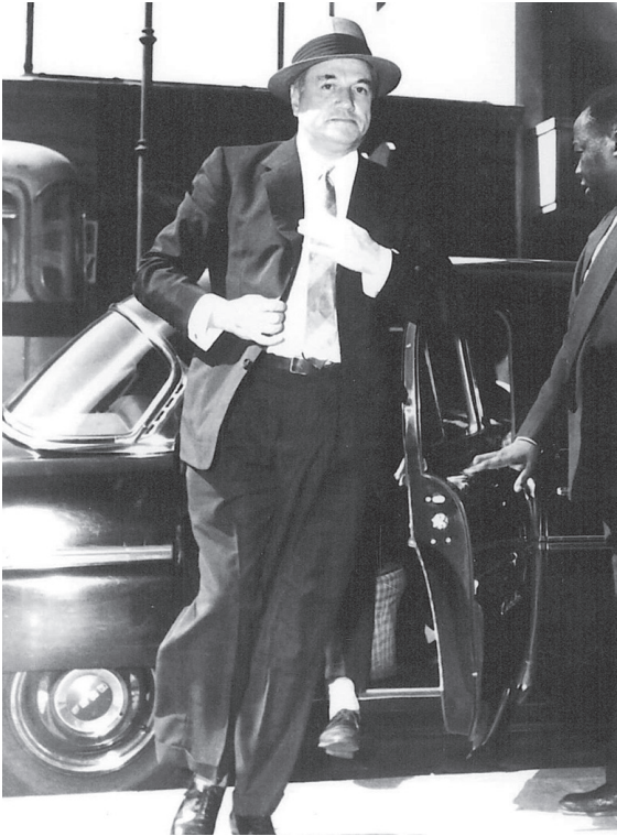
Prebisch en La Habana, 1949.

Me siento humildemente muy orgulloso y agradecido de poder continuar colaborando con esta institución y en el equipo de la Revista CEPAL . Hemos completado 35 años de labor ininterrumpida plasmada en 103 ediciones, llegando a ser una de las revistas académicas más prestigiadas de la región. Continuamos, sin embargo, en deuda con la inmensa contribución que debemos a Raúl Prebisch, por lo que nos seguiremos esforzando por acercarnos a los niveles de excelencia que marcaron su vida y su obra.