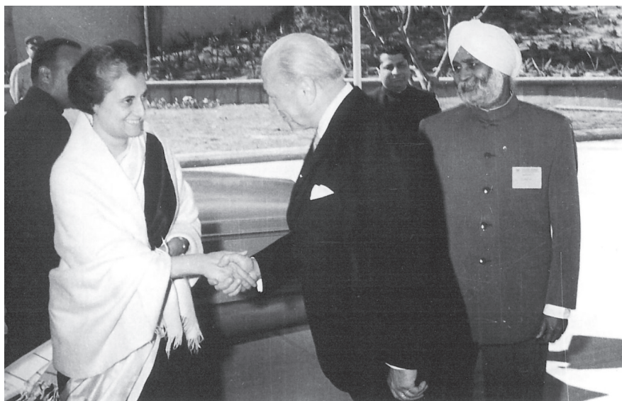
Prebisch en Nueva Delhi con Indira Gandhi, 1968.

Si bien Prebisch insistía en la necesidad de un Estado activista que guiara el desarrollo, nunca fue un partidario irreflexivo de la industrialización por sustitución de importaciones y nunca creyó en las soluciones fáciles. Ya durante la década de 1950, y con particular dureza en 1956, criticó el abuso y