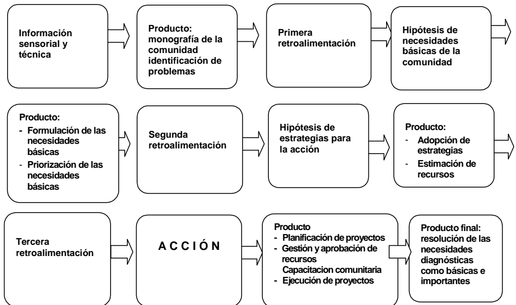
Cuadro 3 DINÁMICA DE IAP ORIENTADA A POLÍTICAS SOCIALES

Recapitulando, entonces, tendríamos una dinámica de IAP orientada a las políticas sociales, que podríamos expresar de la siguiente forma: