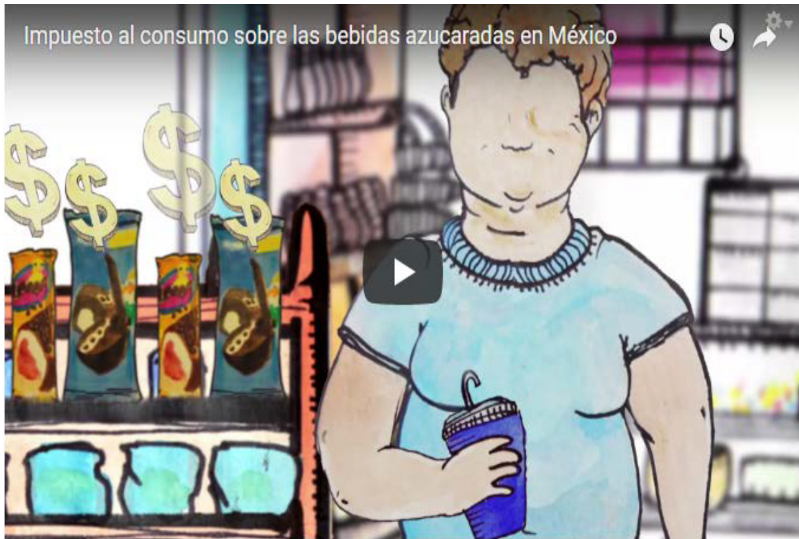
Impuesto al consumo sobre las bebidas azucaradas en México