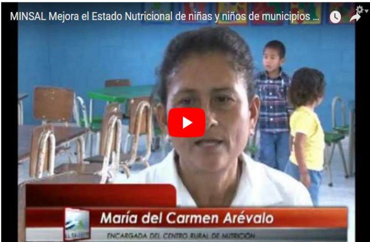
Nutrición y escuelas rurales en El Salvador