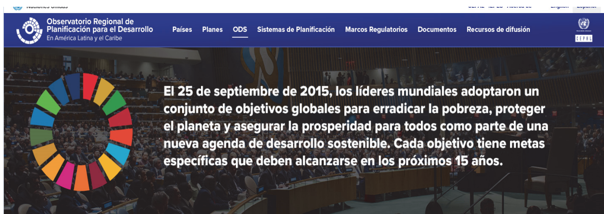
Imagen 1 Plataforma virtual del Observatorio