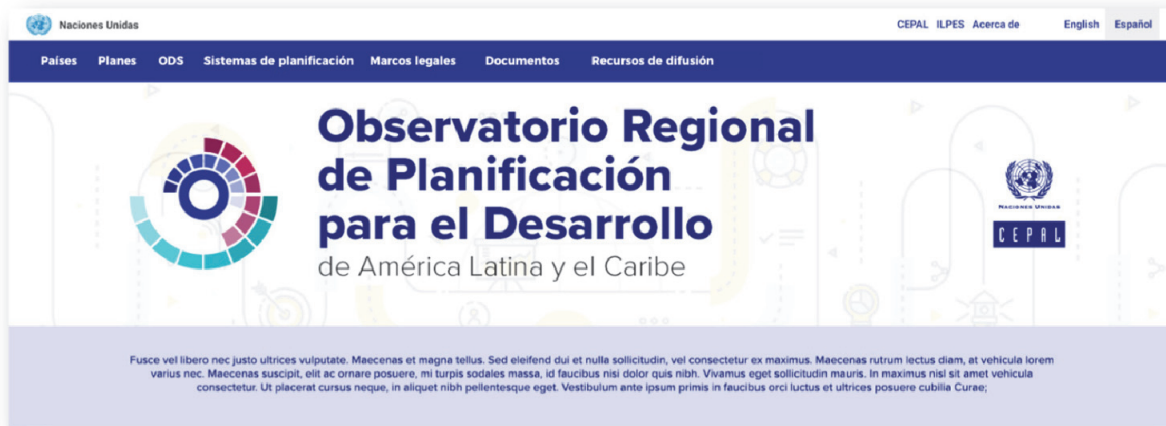
Imagen 2 Página de inicio de la plataforma virtual del Observatorio