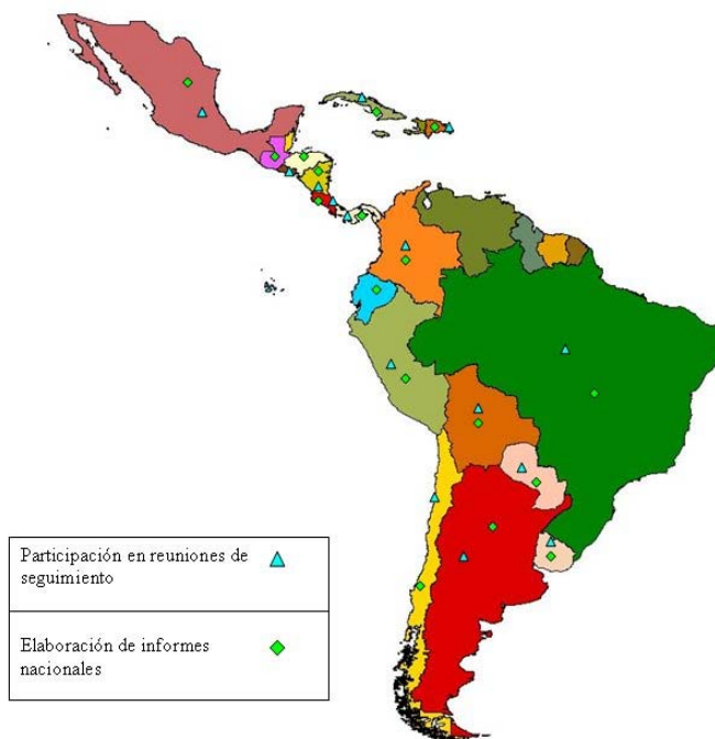
Mapa 1 AMÉRICA LATINA Y EL CARIBE: PARTICIPACIÓN EN LAS ACTIVIDADES DE SEGUIMIENTO DE LA DECLARACIÓN DE BRASILIA a

Fuente: Centro Latinoamericano y Caribeño de Demografía (CELADE) – División de Población de la CEPAL.