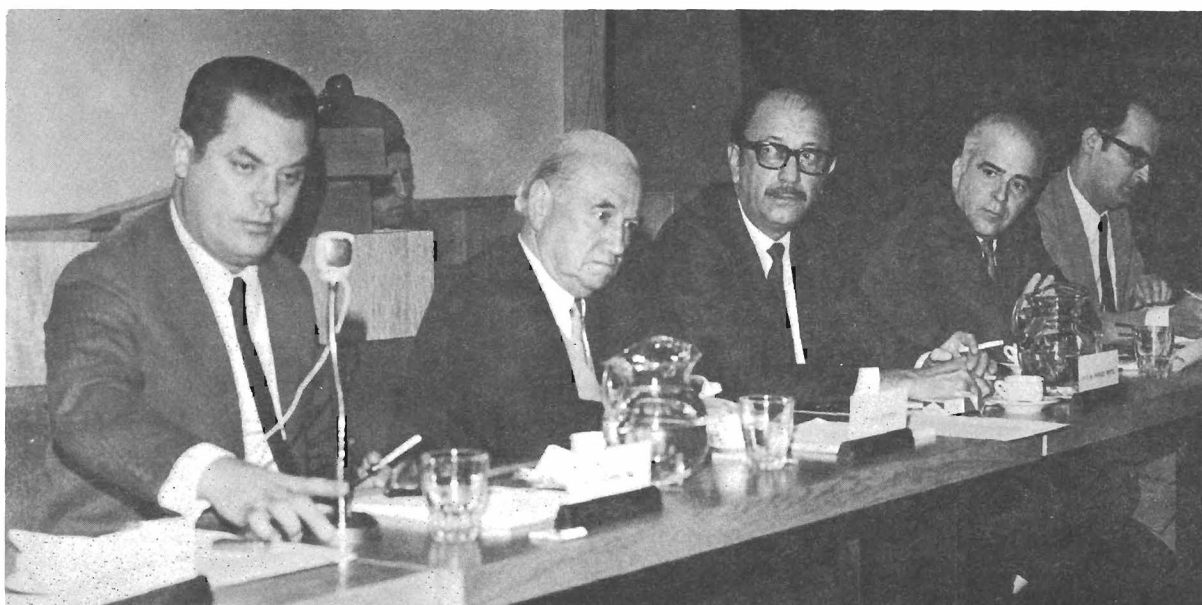
estudios sobre el desarrollo del Estado de Minas Gerais