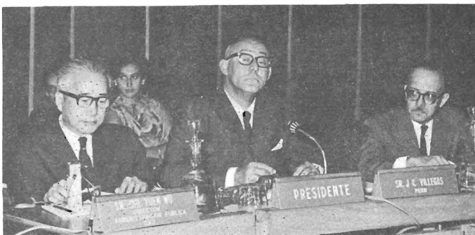
- Seminario sobre Aspectos Administrativos -

A fin de ayudar a los gobiernos latinoamericanos en la solución de los problemas que confrontan sus sistemas de administración pública, la CEPAL intensificará los servicios de asesoría e investigación que viene prestando en ese campo.