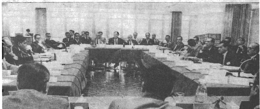
Aspectos de la Reunión