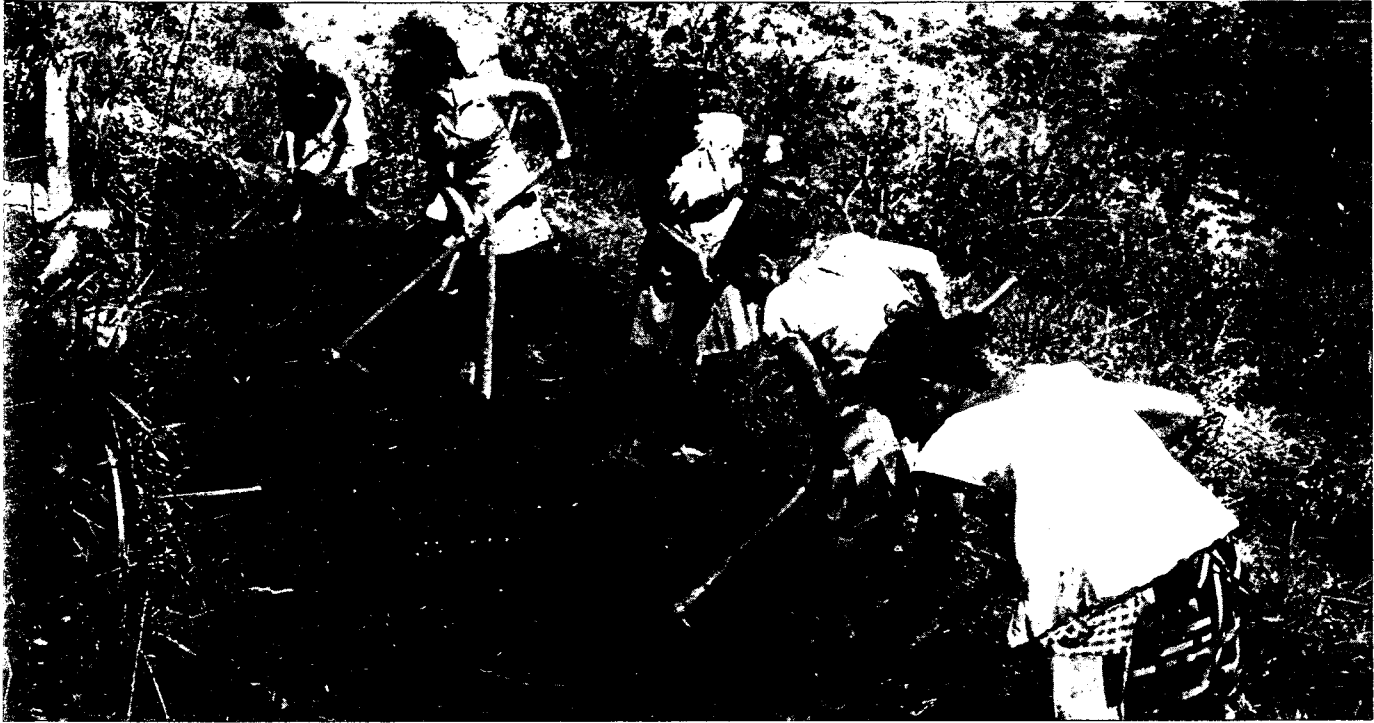
Mujeres organizadas en Centro América preparan una terraza anti-erosión para el cultivo de hortalizas.

poco tenían que ver con el crecimiento económico. Ambas ideas tuvieron una fuerte influencia en la forma como se percibió y se utilizó el medio ambiente (Leonard 1987).