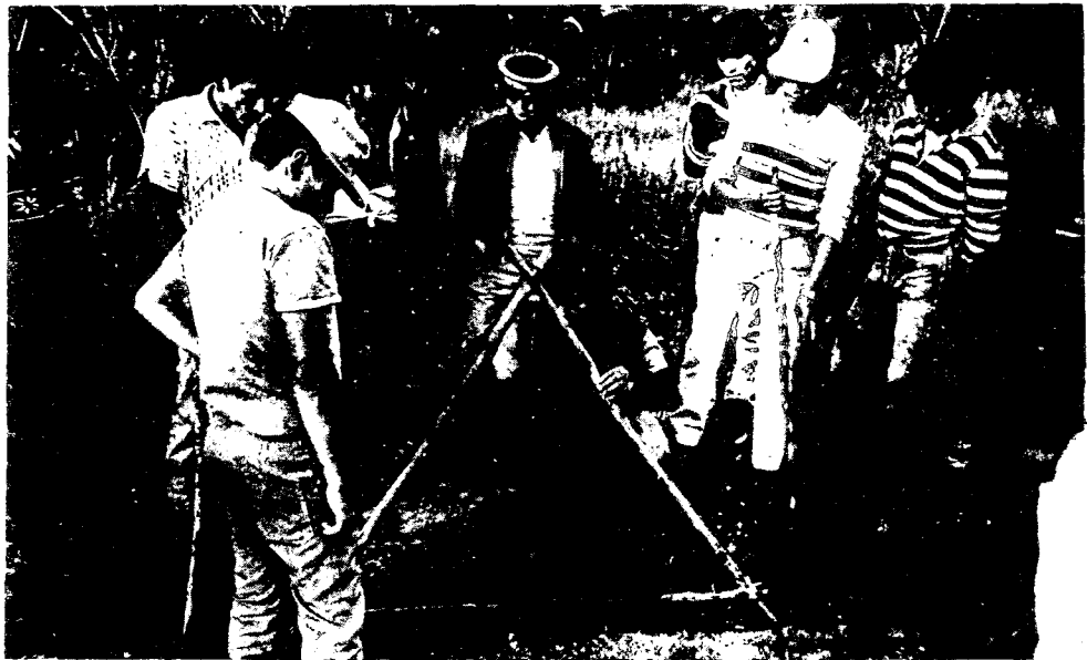
Campeñas Indígenas de la selva peruana recibiendo capacitación en el nivel A.

gramas que procuran fortalecer la identidad de las comunidades campesinas, especialmente las de carácter indígena, se