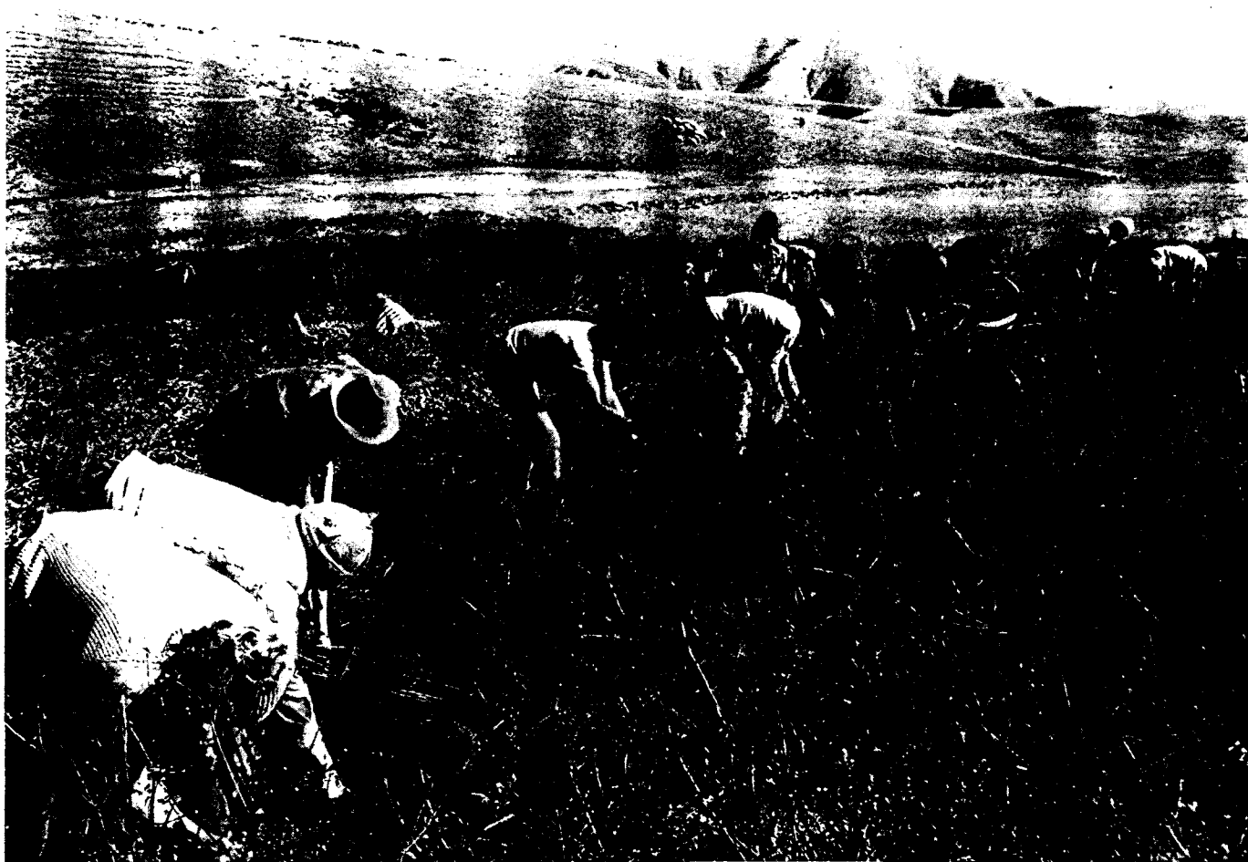
Trabajo comunal en el valle de Pocona, Bolivia, durante una cosecha de papas.

Andrés Yurjevic Centro de Educación y Tecnología Santiago, Chile