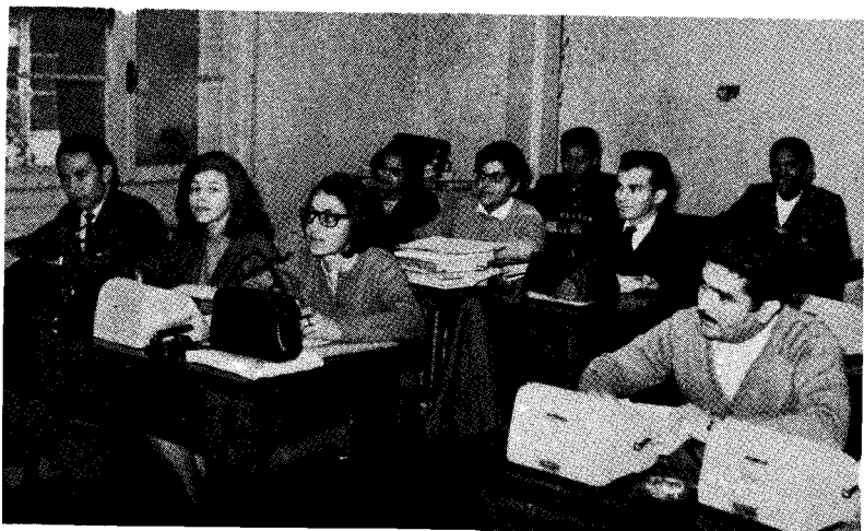
Un grupo de becarios del Curso Básico en clase de matemáticas. En 1968 CELADE tuvo, en sus diferentes cursos, 24 becarios de 12 países de la región.

CURSO AVANZADO. Sólo pueden participar estudiantes seleccionados entre aquéllos que han mostrado especial dedicación y han obtenido resultados satisfactorios en el Curso Básico. Tiene 12 meses de duración, durante los cuales se alternan los períodos de clases con los de exclusiva dedicación a la realización de investigaciones, sobre las que deben presentar tres trabajos.