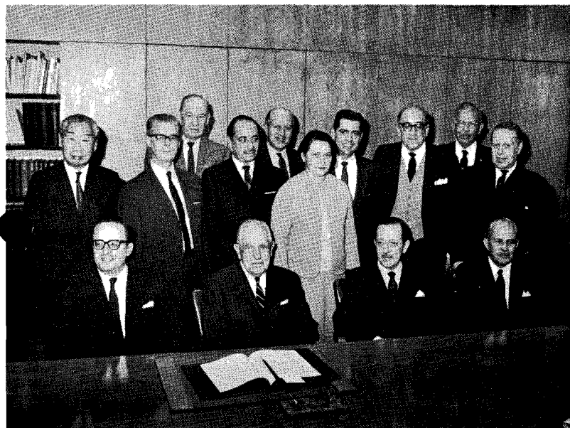
Sede de N.U. Firma del Plan de Operaciones. Embajadores latinoamericanos, funcionarios del PNUD y la Directora de CELADE. Abajo: Firma P.G. Hoffman. Administrador del PNUD.

CELADE recibe, asimismo, financiamiento de la Agencia Internacional para el Desarrollo (AID) y, para programas específicos de investigación, del Consejo de Población.