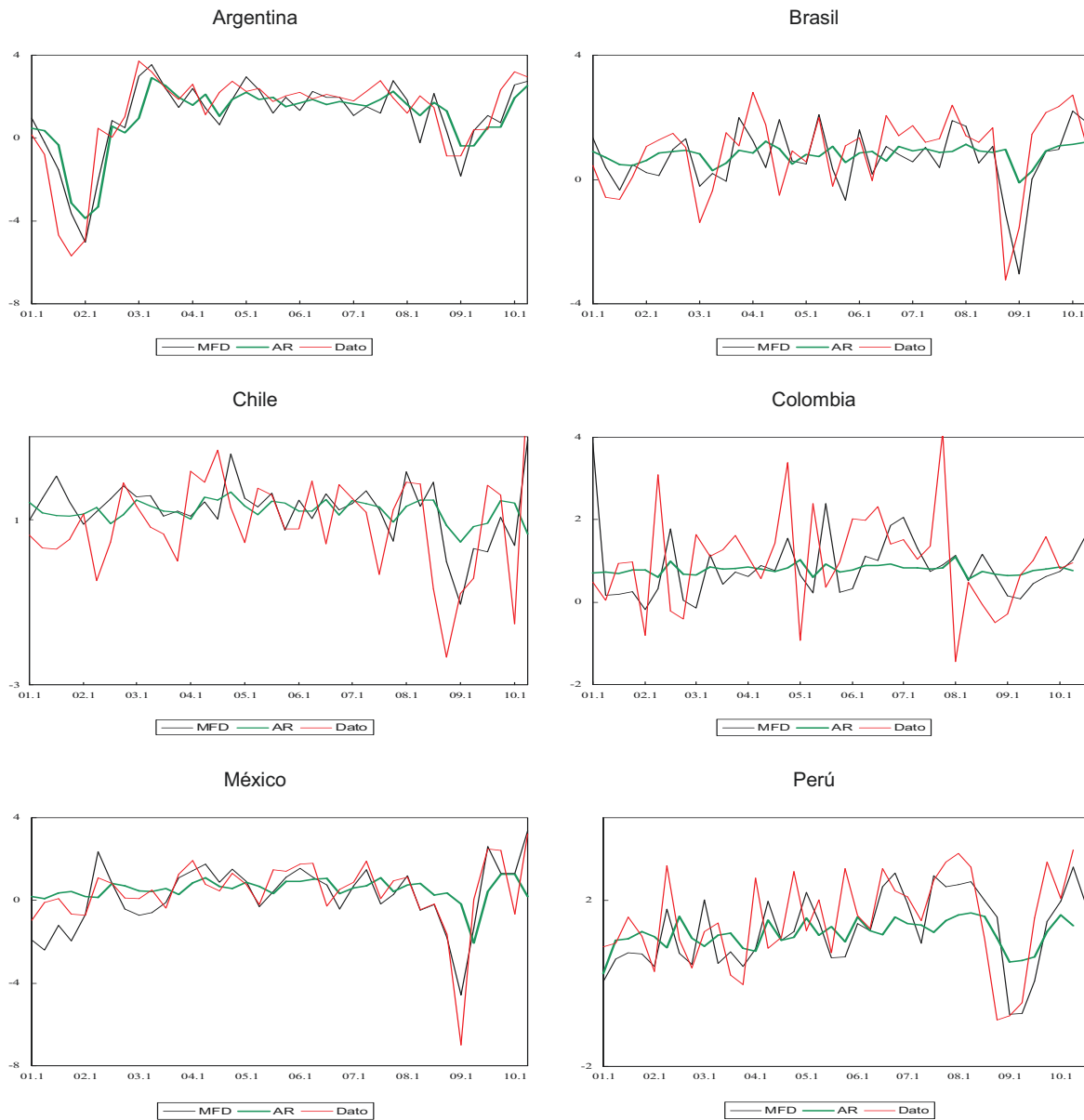
GRÁFICO 3 AMÉRICA LATINA (PAÍSES SELECCIONADOS): TASA DE VARIACIÓN TRIMESTRAL DE LAS PROYECCIONES REALIZADAS CON EL MODELO FACTORIAL DINÁMICO (MFD) Y UN MODELO AUTORREGRESIVO TRADICIONAL (AR) a